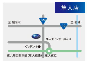
霧島市隼人町真孝446-2

・現地までの交通費等は当選者様のご負担となります。 ・スケジュールは天候、その他主催者が危険と判断した場合は予告なく変更又は中止する場合がございます。 ・受付時に運転免許証の確認をさせていただきます。 ・参加日の変更はいたしかねます。 ・未成年者が当選された場合、当選後、保護者の承認が必要となります。 ・ドライビングに適した服装、スニーカー等運転しやすいシューズでご参加下さい。 ・ヒールの高い靴やサンダルなど運転に適さない履物でご来場の場合、試乗をお 断りさせていただきますので、運転に適した履物での来場をお願いいたします。(かかとの固定されないサンダルや運動靴、ハイヒール、ミュール等では試乗いただけ ません。) ・安全上の都合により小さなお子様の同伴はご遠慮ください。またペットをお連れのご参加(見学会含む)も遠慮ください。 ・お客様が主催者の指示に従わず に発生した事故の責任は負いかねるものとします。 ・キャンペーンの内容及び試乗内容は、予告なく変更になる場合がございます。 ・(株)SUBARUおよび SUBARU販売店関係者の応募は、ご遠慮ください。