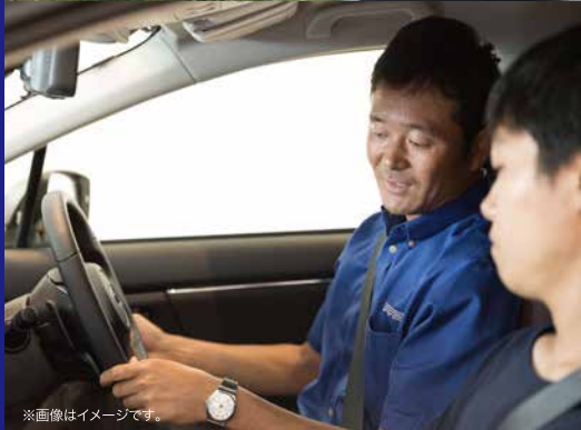
※画像はイメージです。