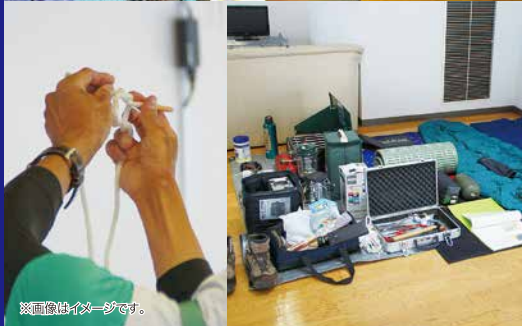
※画像はイメージです。